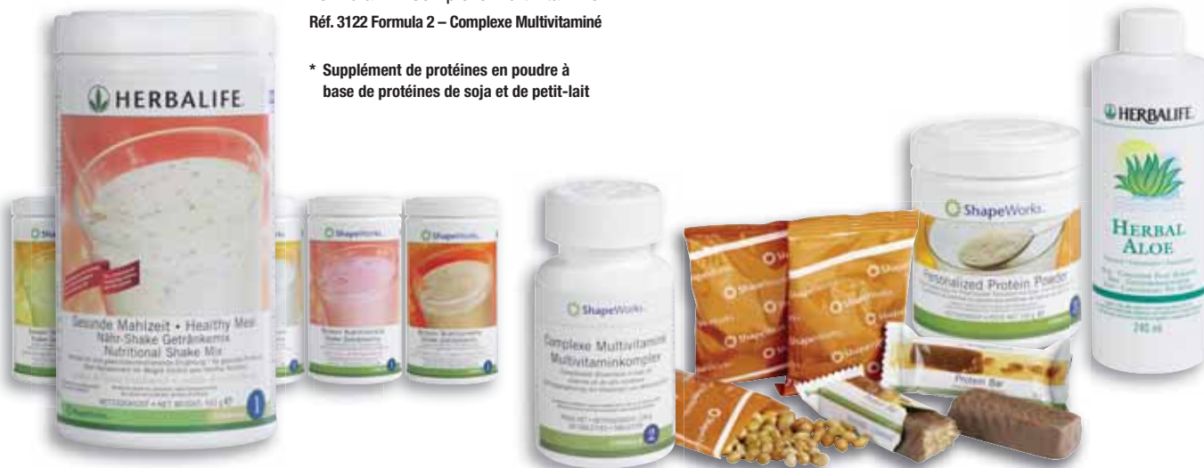
Images non représentatives - les nouveaux visuels n'étant pas disponibles avant l'impression.