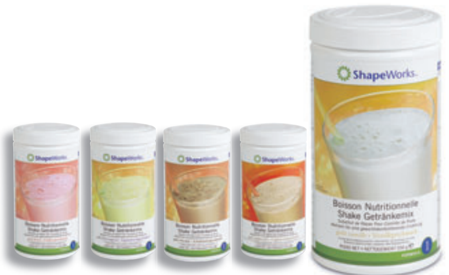
Vanille Réf. 0141 Chocolat Réf. 0142 Fraise Réf. 0143 Fruits Tropicaux Réf. 0144 Cappuccino Réf. 1171

Et pour conclure cette longue liste d'avantages, la Formula 1 – Boisson Nutritionnelle se décline en cinq parfums délicieux : Vanille, Fraise, Chocolat, Fruits Tropicaux et Cappuccino. Par lequel allez-vous d'abord vous laisser tenter ?