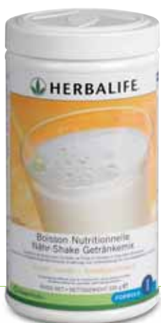
Réf. 0141 Vanille